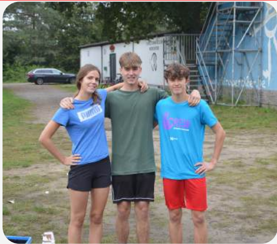
1 NIEUWE LEIDING DIE WERD INGEDOOPT

OP ZONDAG 29 SEPTEMBER VIERTEN WE DE OVERGANG NAAR HET NIEUWE CHIROJAAR. OUD-LEIDING WERD UITGEDOOPT EN DE NIEUWE LEIDING WERD INGEDOOPT. EEN MOOI BEGIN VAN EEN NIEUW AVONTUUR!