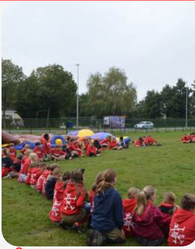
2 DE LEDEN WAREN DE TOESCHOUWERS BIJ DE DOOP