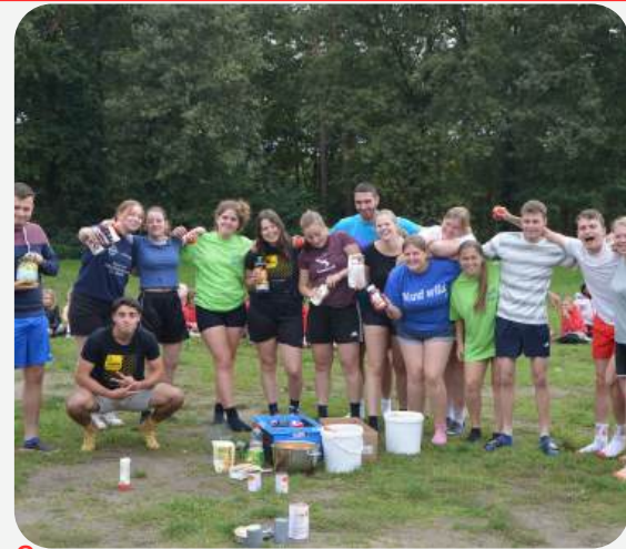
3 OUD-LEIDING DIE WERD UITGEDOOPT

Op zondag 29 september was het tijd voor de overgang naar het nieuwe Chirojaar! De oud-leiding werd met veel dankbaarheid uitgezwaaid, terwijl de nieuwe leiding met een gezonde dosis zenuwen en enthousiasme werd verwelkomd. Voor de oud-leiding was het een moment van afscheid van een avontuur dat ze jarenlang met hart en ziel hadden beleefd. De nieuwe leiding begon dan weer vol frisse energie aan hun eigen avontuur.