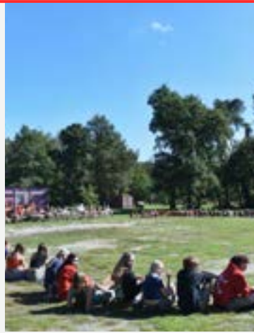
2 DE LEDEN WAREN DE TOESCHOUWERS BIJ DE DOOP