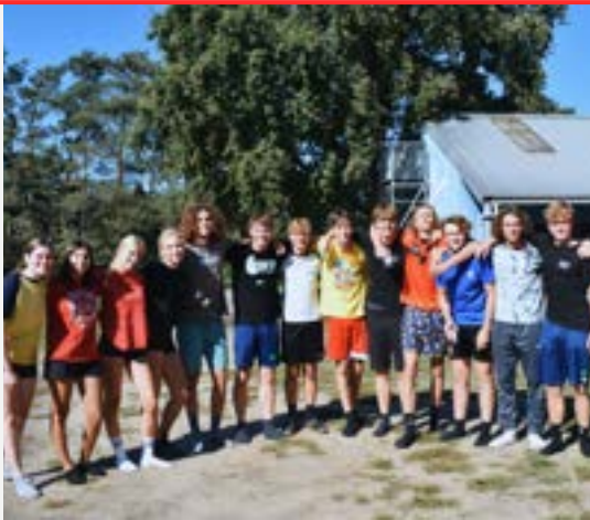
1 NIEUWE LEIDING DIE WERD INGEDOOPT

OP ZONDAG 24 SEPTEMBER VOND ONZE OVERGANG PLAATS. HET NIEUWE CHIROJAAR WORDT DAN INGEZET: OUD-LEIDING WORDT UITGEDOOPT EN NIEUWE LEIDING WORDT INGEDOOPT.