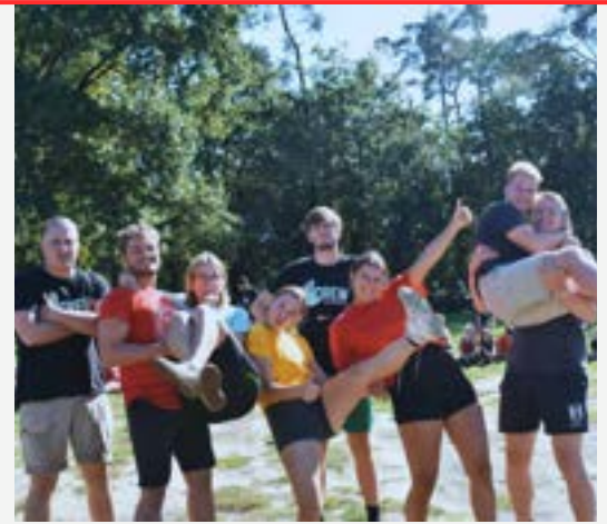
3 OUD-LEIDING DIE WERD UITGEDOOPT

Op zondag 24 september was het weer zover: de oud-leiding verzamelde zich om uitgezwaaid te worden en de nieuwe leiding werd verwelkomd met open armen. Met enthousiasme, maar ook een gezonde dosis zenuwen begon de leiding aan de doop. Het zonnetje stond hoog aan de hemel en er waaide een briesje wind door de bomen, deze dag kon niet anders dan een knallende Chirozondag worden. Na de doop speelden de leden nog een spel dat hen hielp hun leiders te weten te komen voor het nieuwe Chirojaar. Daarna wachtte er nog een smakelijke traktatie: hamburgers recht van de grill! Want wat is een overgang zonder een sappige hamburger met gebakken uitjes op een heerlijk krokant pistoleeke? En alsof dat allemaal nog niet genoeg was, werd de zondag afgesloten op het gigantische springkasteel. Met lachende gezichten en wapperende haren sprongen de leden, en de leiding ;), erop los. Op de volgende pagina's kan je de groepen met hun nieuwe leidingsgroepje bewonderen!